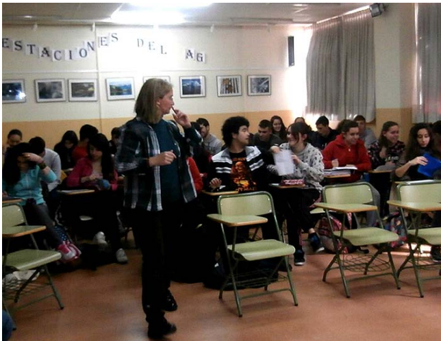
Los alumnos de 1º de Bachillerato anotan la cantidad aproximada de agua gastada en sus casas