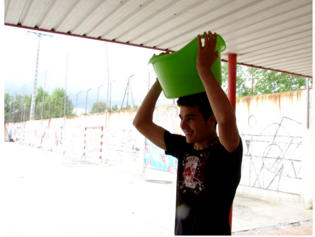
Igual que Miguel