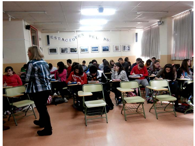
Los mismos alumnos opinan por escrito sobre la situación que se vive con el agua en el mundo