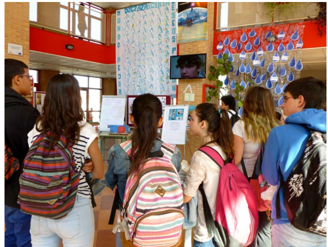
Hubo bastante expectación, en el vestíbulo, durante la presentación; aunque el sonido dejó algo que desear.