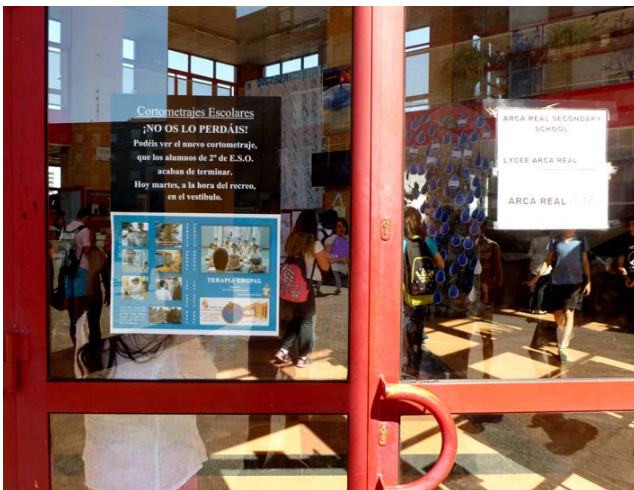
Detalle del cartel anunciador a la entrada del instituto. Dentro, la gente se prepara para asistir al evento.