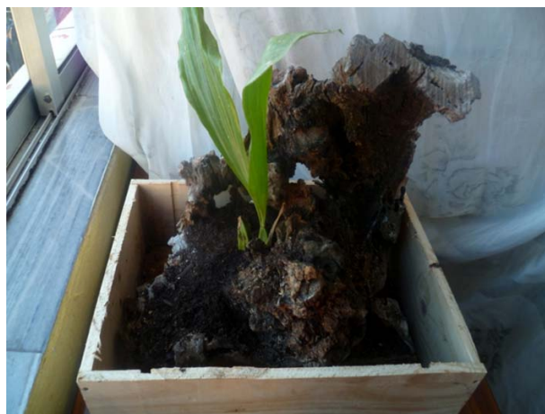
La orquídea salvaje de Ecuador crece en una corteza de roble segoviano