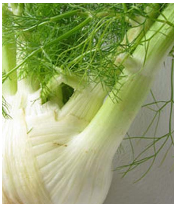
Planta de hinojo rumano enviada por la abuela