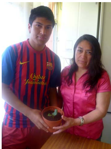
Primer brote del zambo ecuatoriano