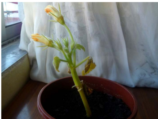
Aspecto del zambo ecuatoriano a 25 de mayo de 2014