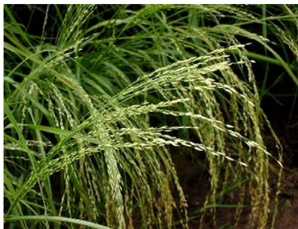
Planta de teff etíope encontrada por Thomas en Internet