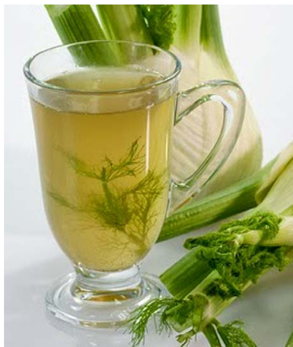
Infusión de hinojo