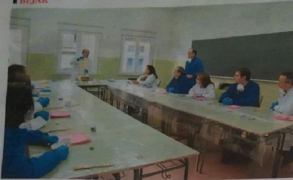
Un equipo de profesores y voluntarios externos trabaja ya para rehabilitar el archivo del centro de FP.