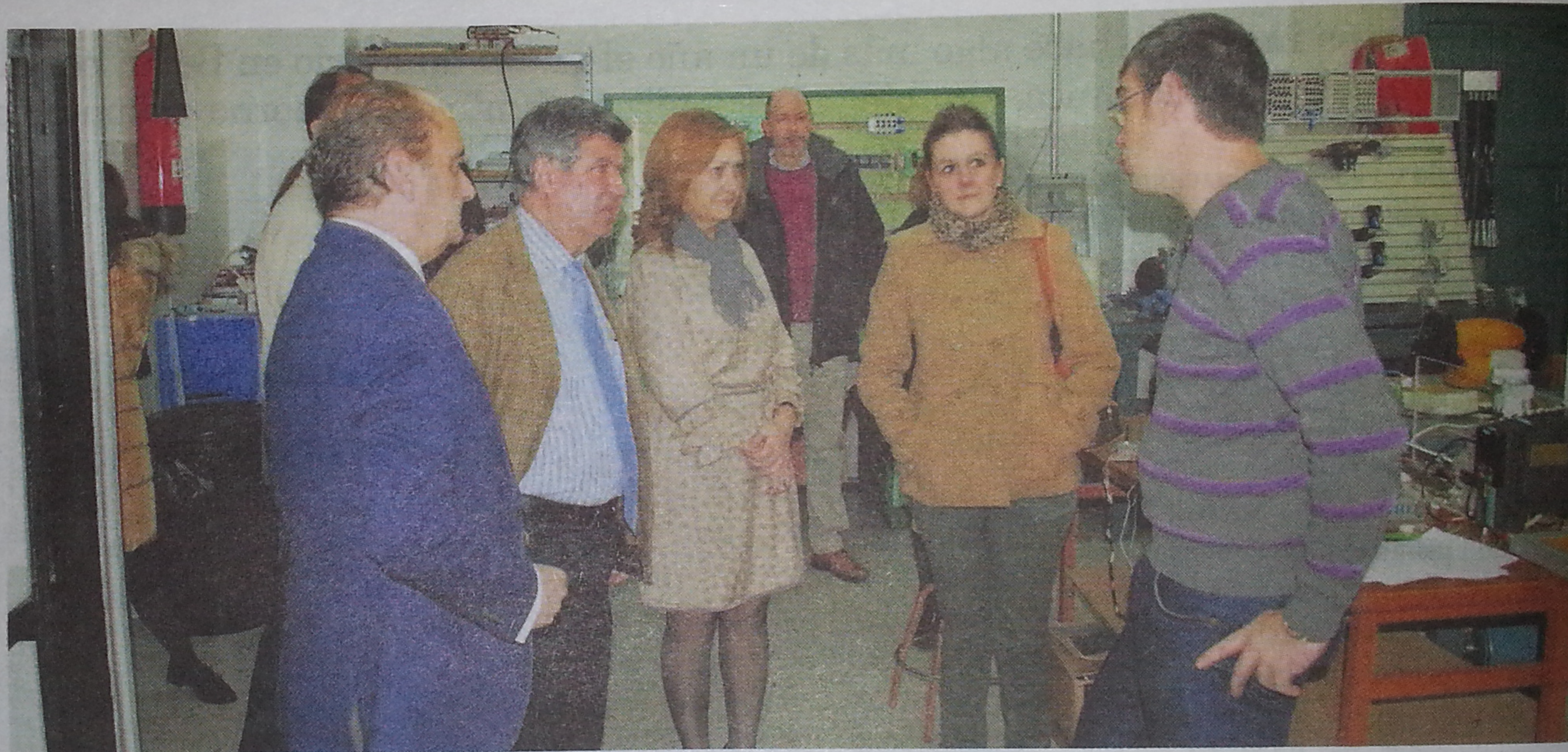
El alcalde y las concejales junto al director del centro visitando uno de los talleres de las especialidades que se imparten.

Este ofrecimiento, que ayudaría a incentivar el mercado laboral en la ciudad, tuvo lugar en el marco de la visita a las instalaciones en la que las