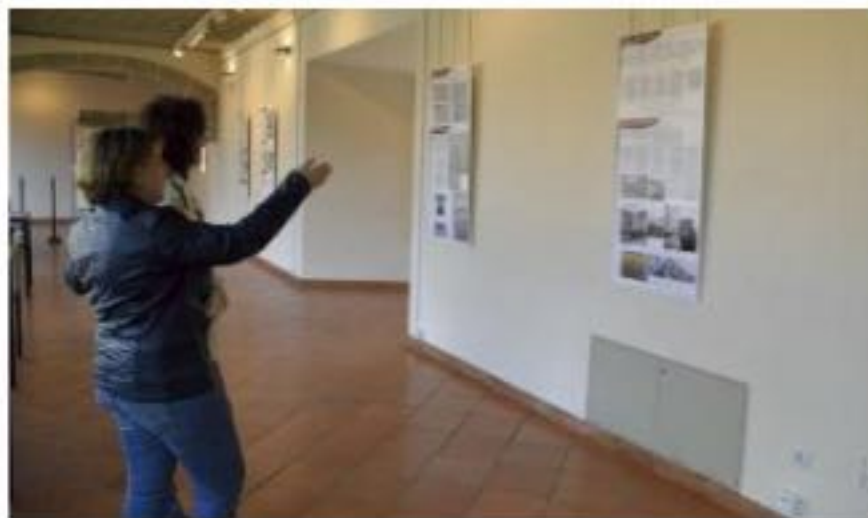
Imagen de la muestra, que ha estado expuesta en el covento de San Francisco.

Béjar se hace eco en julio de 1852 de este decreto e inicia de forma oficial la apertura de la Escuela Industrial con un presupuesto inicial de 48.000 reales. El primer emplazamiento fue en calle Mansilla- actualmente se puede ver una placa que hace referencia a ello- y compartía espacio con la Escuela Municipal de Enseñanza Elemental. Posteriormente se trasladó a otro edificio de la misma calle, pero con entrada por la calle Quebradilla. Por último, en 1866, el Consistorio decidió instalarla en el edificio del viejo Palacio Ducal. En la sesión del 28 de agosto de ese año, el ayuntamiento contestó a una carta enviada por el Rector de la Universidad de Salamanca a este respecto, señalando que se había procedido