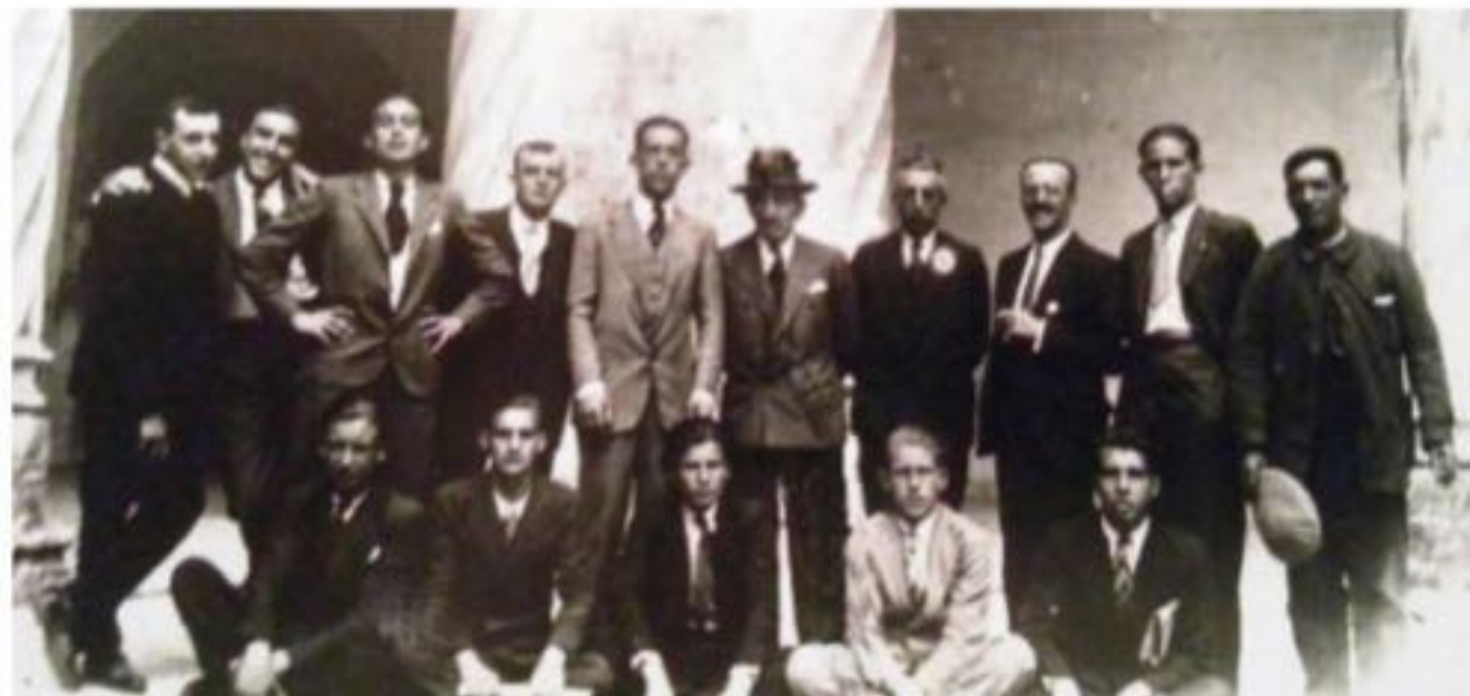
Personal y alumnos de la escuela sobre 1930.

**La información aquí recogida es la que se puede ver en los paneles informativos de la muestra.