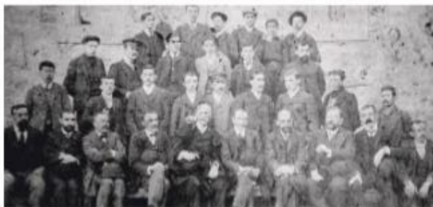
Foto de las primeras promociones. En la primera línea están los profesores.