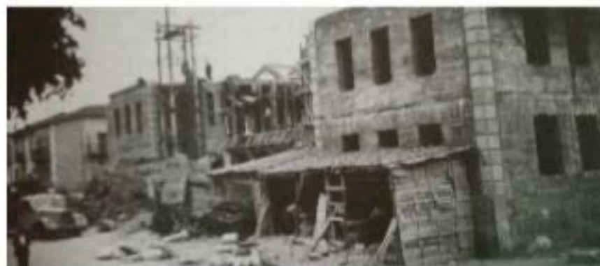
Obras en el edificio del Centro de Formación Profesional, donde estuvo la escuela.