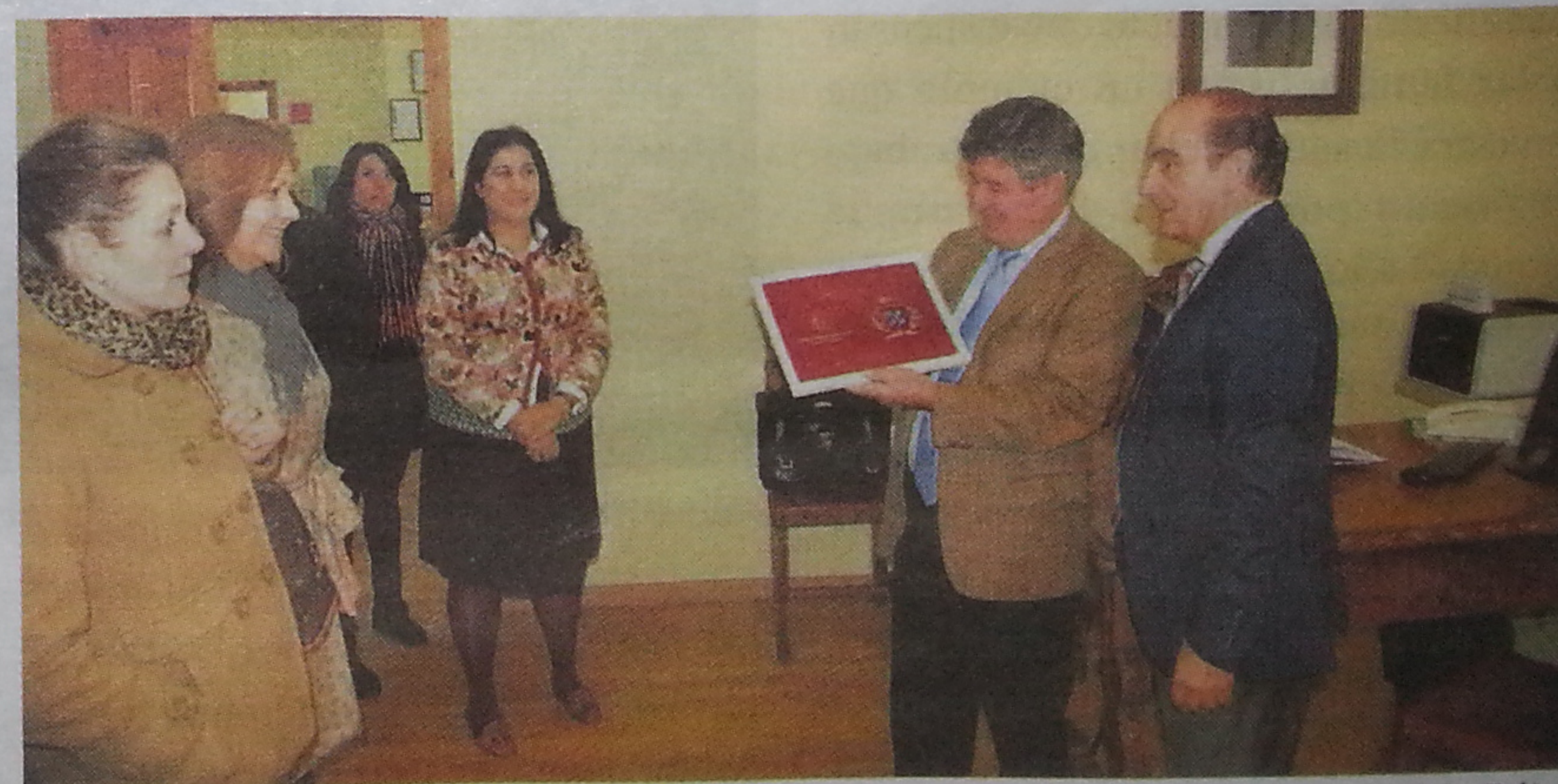
El centro regaló al alcalde un cuadro con el escudo de la ciudad de Béjar.

En la actualidad el Centro Integrado cuenta con 200 alumnos divididos en las tres especialidades.