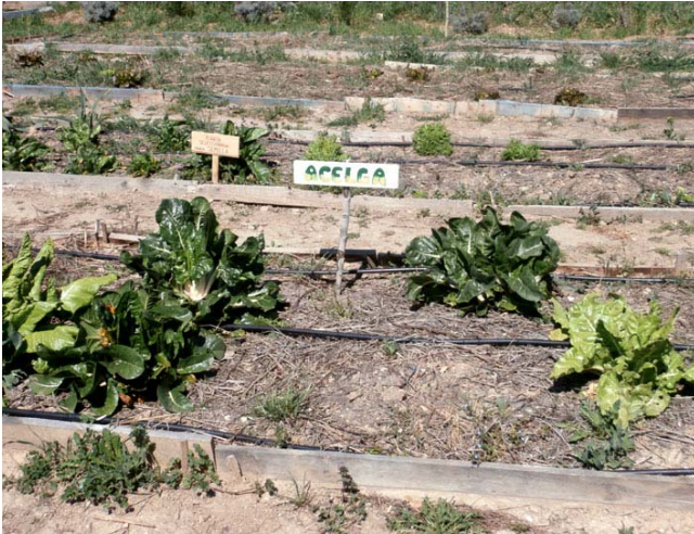
Cultivo de acelgas