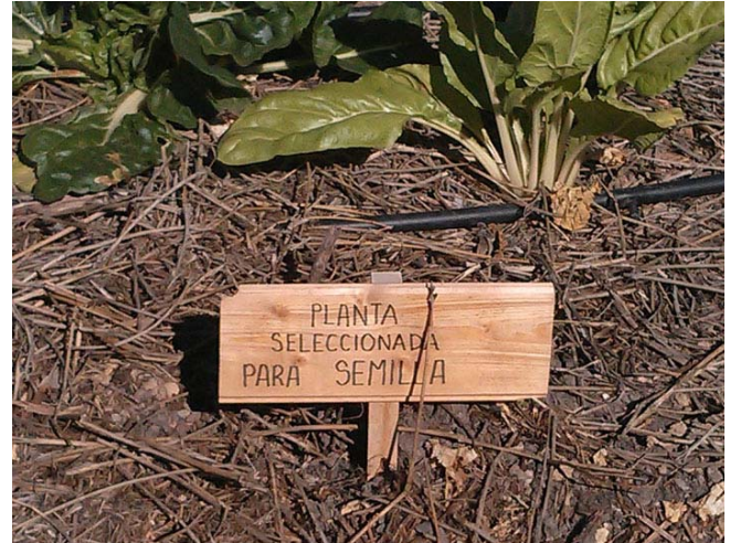
Planta seleccionada para semilla