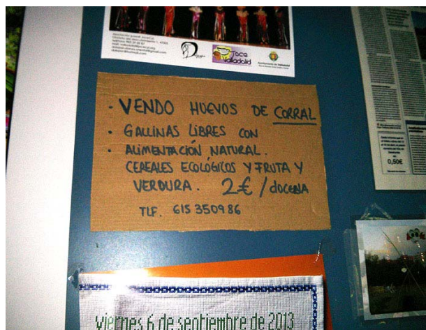
Las dificultades de acceso al mercado de productos ecológicos de pequeños productores son infinitas

“¿Por qué cuando en el mercado algún tendero nos proporciona productos de su huerta se ve obligado casi siempre a hacerlo a escondidas?” (La foto superior derecha, tomada en el tablón de anuncios de un bar de La Victoria, ilustra el hecho).