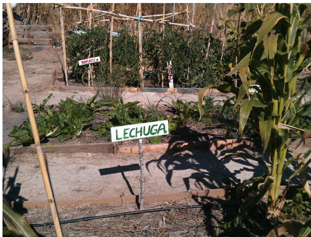
La lechuga se desarrolla en climas templados y se recolecta durante el verano, pero...