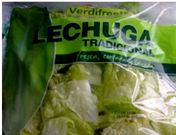
...¿por qué las encontramos en los supermercados durante todo el año?