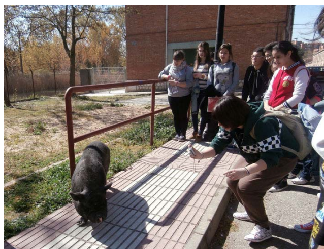
Jugando con un animal doméstico