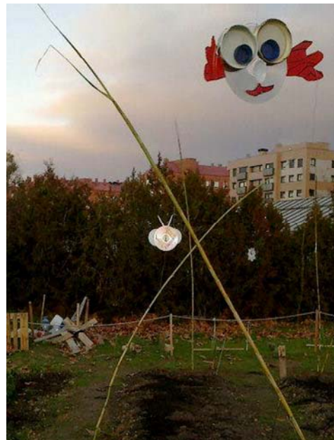
Taller de espantabichos