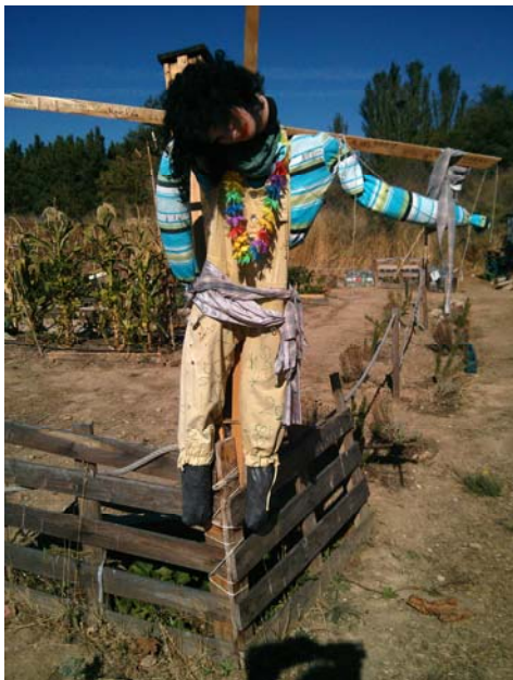
Taller de espantapájaros