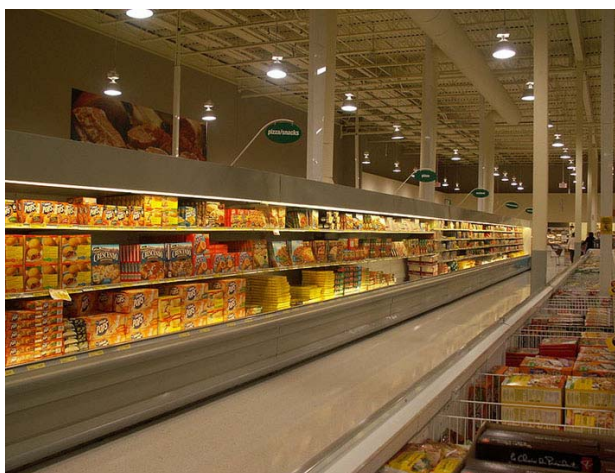
Las grandes superficies disfrutan de todas las ventajas (Supermercado Winkler)