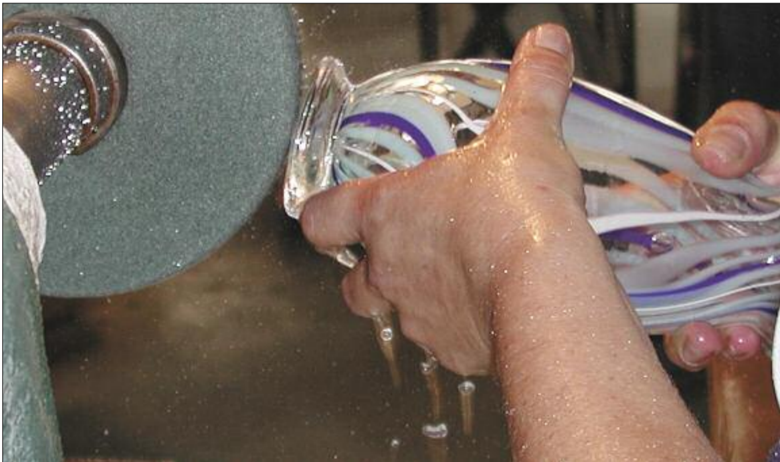
El Grado en Vidrio forma a profesionales cualificados en este campo artístico. / CONSEJERÍA DE EDUCACIÓN

La Junta de Castilla y León, la Fundación Centro Nacional del Vidrio y la Fundación para la Enseñanza de las Artes en Castilla y León participan en este grado pionero en nuestro país, que puede cursarse en Segovia