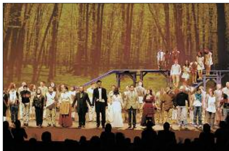
Participantes en un montaje de ópera en el Conservatorio Superior de Música.

Música se imparte en el Conservatorio Superior de Música, ubicado en Salamanca, un moderno centro de singular arquitectura donde 84 profesores transmiten sus conocimientos a los 253 alumnos matriculados este curso. Los estudiantes pueden elegir entre cualquiera de las 25 especialidades que se imparten en sus aulas, distribuidas en Composición,