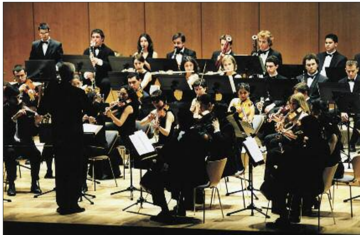
Orquesta sinfónica del Conservatorio Superior de Castilla y León.