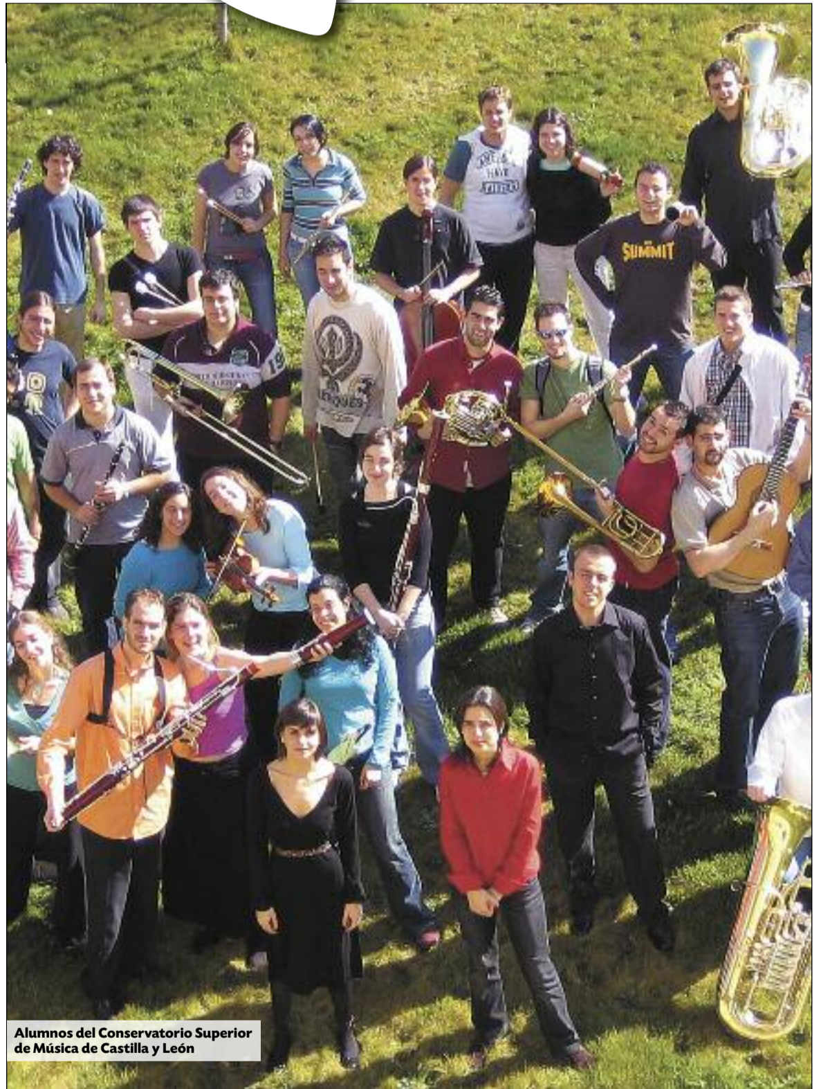
Alumnos del Conservatorio Superior de Música de Castilla y León

La Consejería de Educación de la Junta de Castilla y León ofrece la posibilidad de cursar cinco titulaciones de este ámbito, equivalentes a todos los efectos a los estudios universitarios. pág. 2