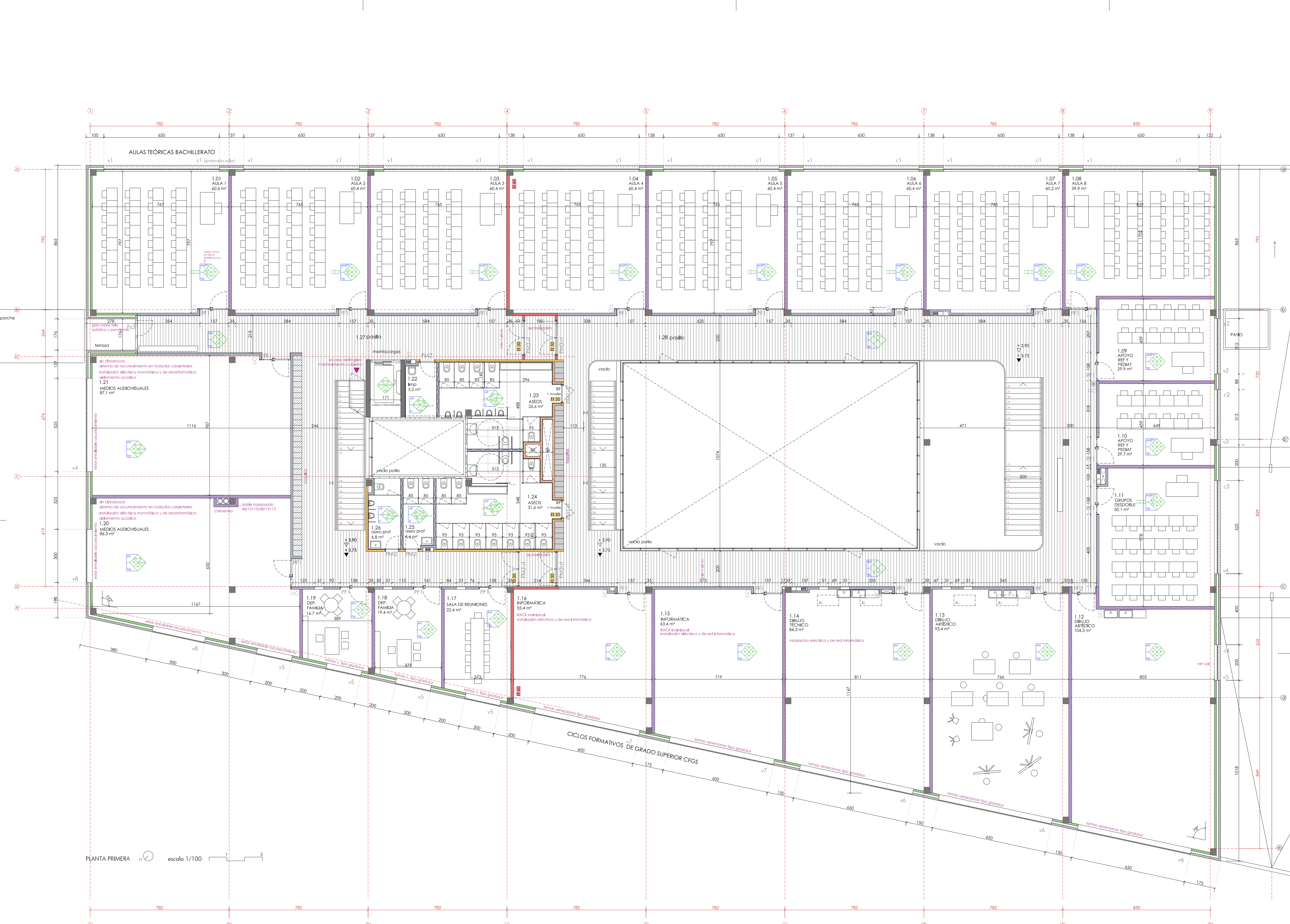
PLANTA PRIMERA escala 1/100