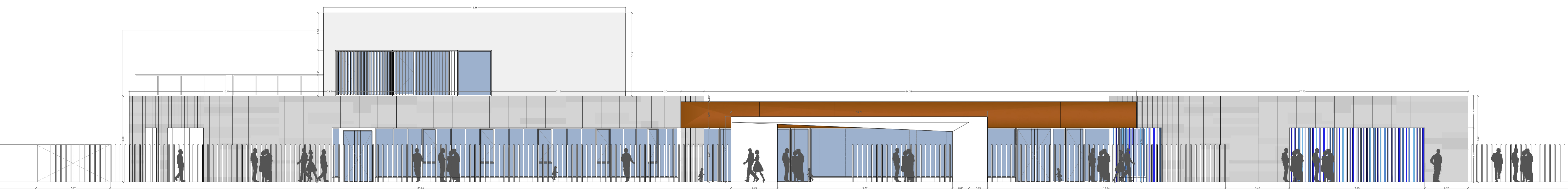
ALZADO C-C' - calle