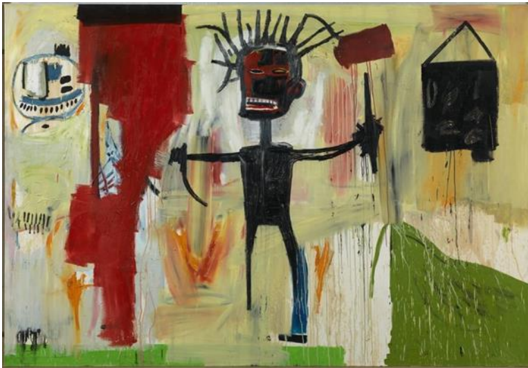
Jean-Michel Basquiat, Autorretrato, 1986.

B4.- Explica la perspectiva intercultural en el arte a partir de la siguiente obra de Basquiat. Simbolismo, composición, estilo.