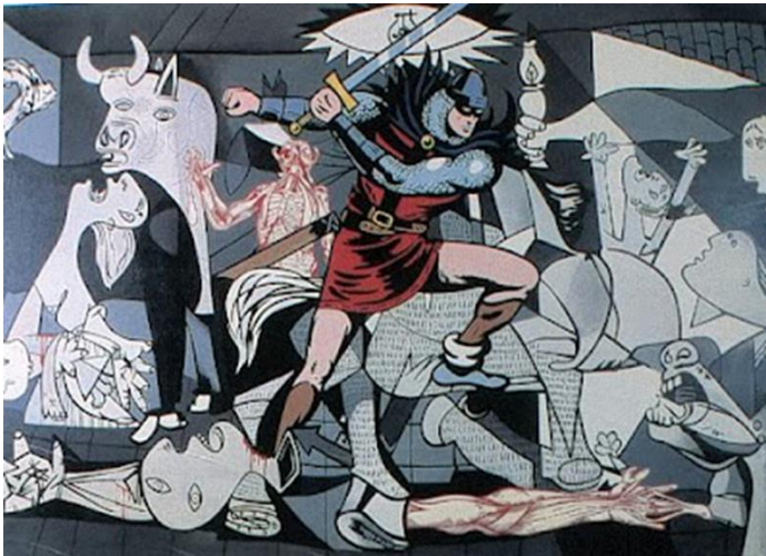
Equipo Crónica, El intruso, 1969.

B5.- Analiza y comenta la obra que aparece en la imagen: características, estilo, movimiento al que pertenece y contexto histórico.